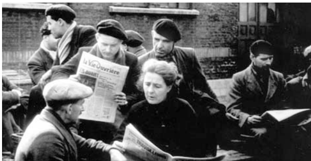
La grande lutte des mineurs

En partenariat avec Plan-Séquence et le Cinémoïda d'Arras, CCAS/CMCAS, CER cheminots Nord-Pas de Calais, les Amis de l'Humanité.